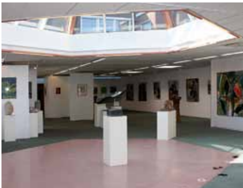
Interieur P'Arts Galerie